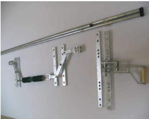
F6: complete pole operation system