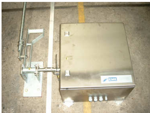
F2: Motordrive type HE