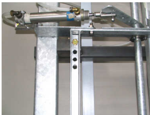
F3: Pneumatic drive