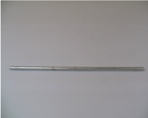
F5: shaft extension